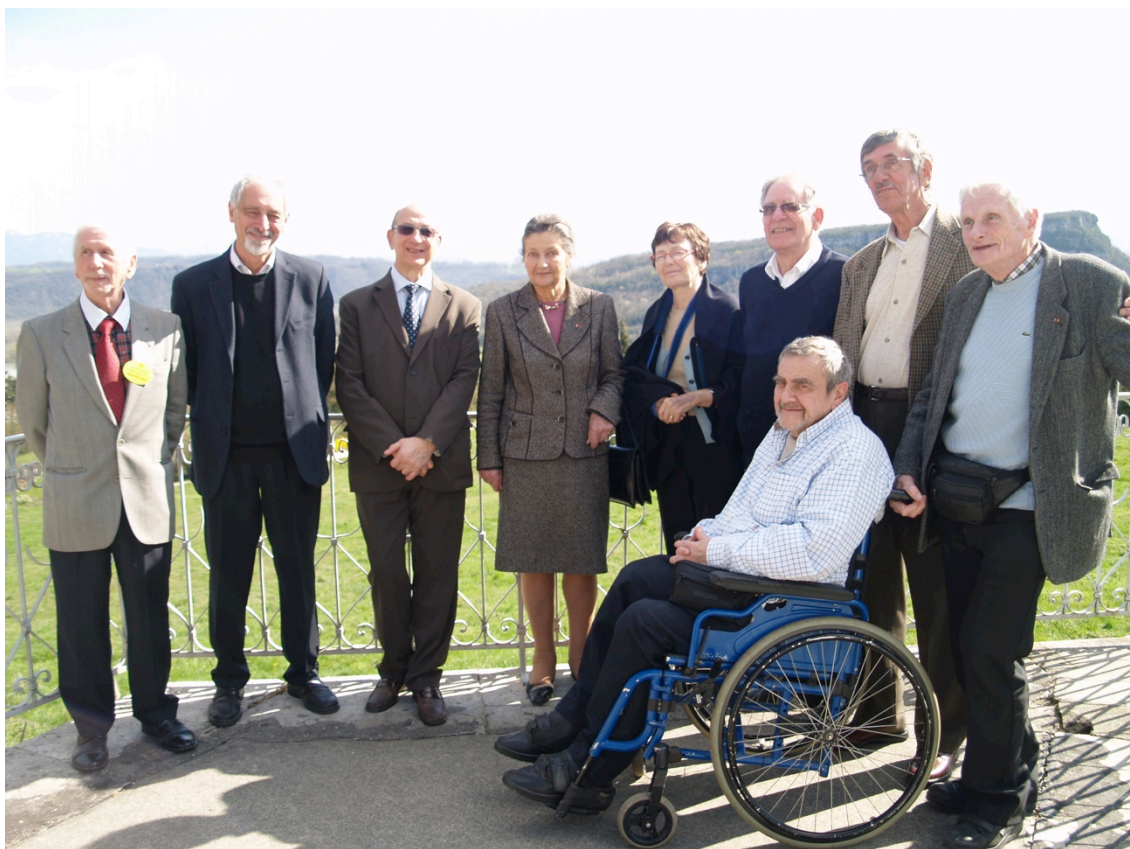
Les "anciens d'Izieu" autour de Simone Veil et d'Hélène Waysbord 6 avril 2010 Georges Hirtz es au premier plan

Le CDT01/ Syndicat Mixte du Pays du Bugey a réalisé en septembre 2012, une série de vues du site de la Maison d'Izieu pour une vidéo de promotion des activités autour de la Via Rhôna , piste cyclable passant en contrebas du mémorial et reliant le Léman à la Méditerranée.