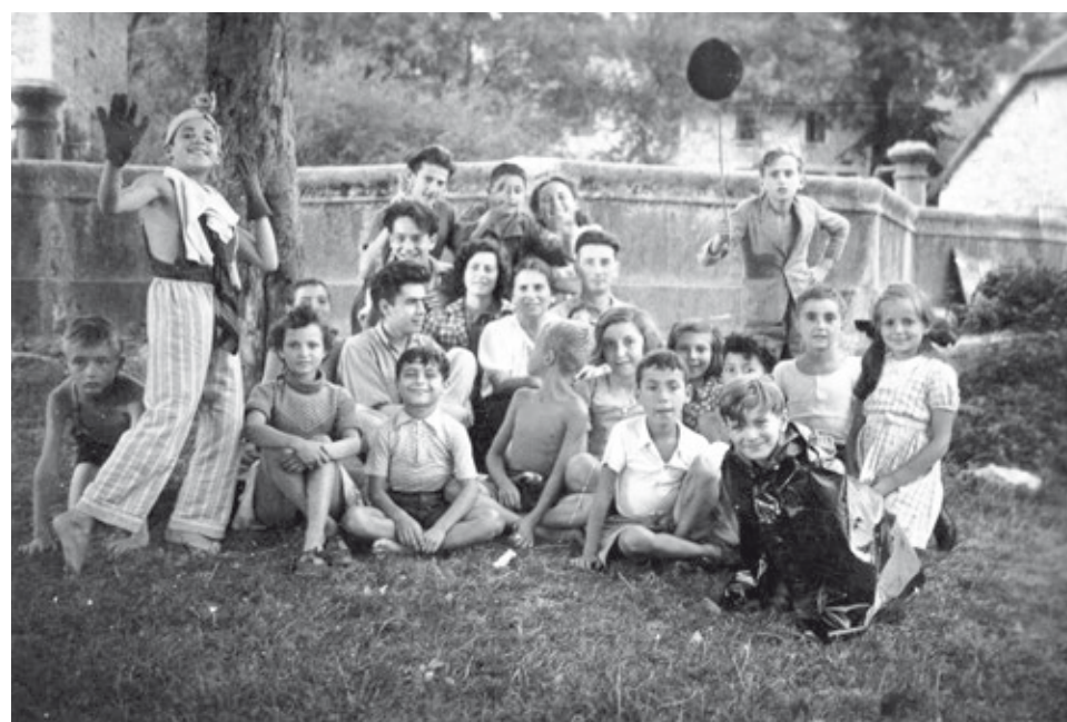
Été 1943 - Fête à la colonie

Incarné par les figures de Serge et Beate Klarsfeld, leur engagement citoyen, la fidélité au souvenir de la Shoah, le courage et leurs convictions sont autant de repères aujourd'hui pour les jeunes générations pour que les éléments du passé servent à construire un monde plus juste et tolérant.