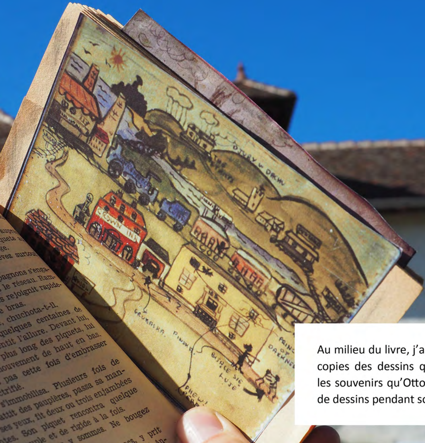
Au milieu du livre, j'ai mis des photo- copies des dessins qui représentent les souvenirs qu'Otto avait des cours de dessins pendant son séjour à Izieu.

— Halte ! Nous y sommes. Ne bougez rien. Prenez l'un des sacs, y prit Gaunce à manche court. An-