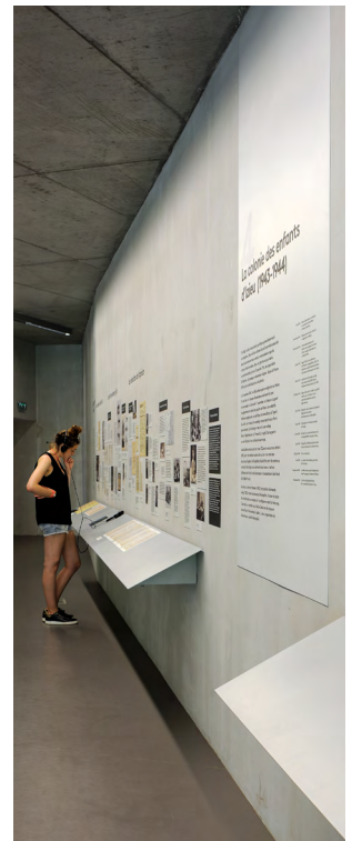
Maison d'Izieu

La Maison d'Izieu reçoit le soutien du ministère de la Culture, du ministère de l'Éducation nationale et de la Jeunesse, de la région Auvergne-Rhône-Alpes, du département de l'Ain, du ministère des Armées-DPMA (Direction des patrimoines, de la mémoire et des archives), de la Préfecture de la région Auvergne-Rhône-Alpes, du ministère de l'Enseignement supérieur, de la Recherche et de l'Innovation, de la DILCRAH (Délégation Interministérielle à la Lutte Contre le Racisme, l'Antisémitisme et la Haine anti-LGBT) et du Fonds de dotation Sabine Zlatin.