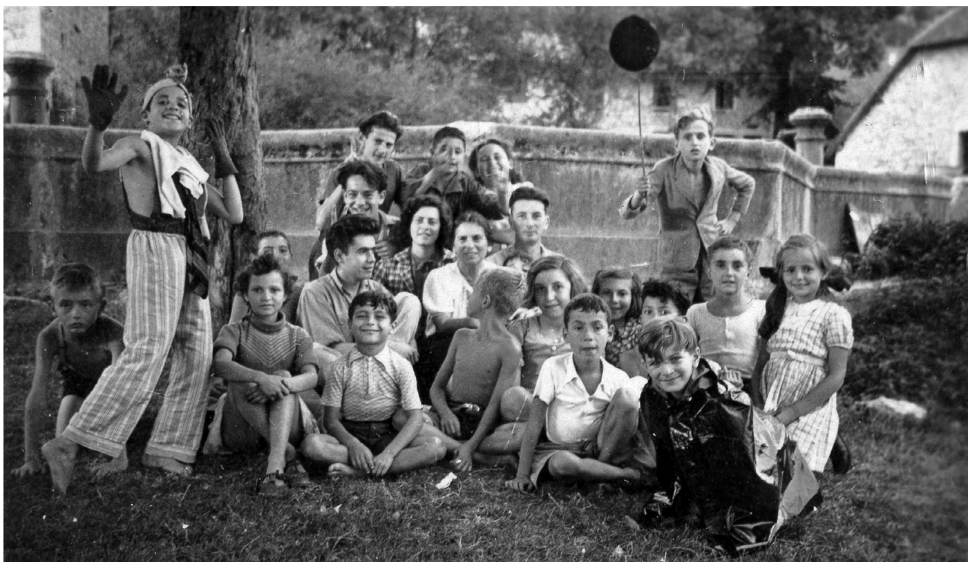
Izieu été 1943