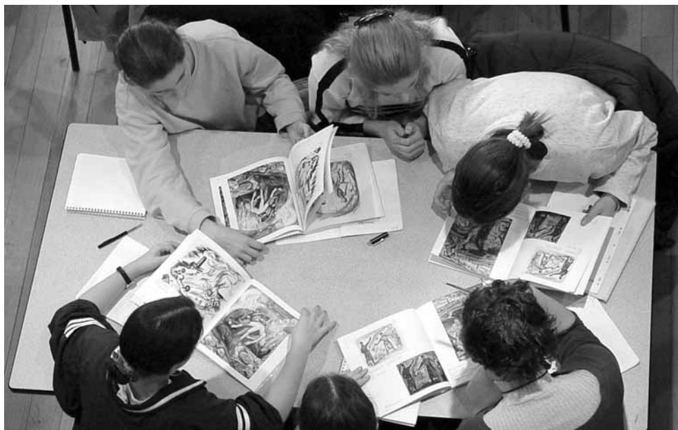
Maison d'Izieu / Eric Ressort

Ces ouvrages et documents sont utilisés au cours des ateliers.