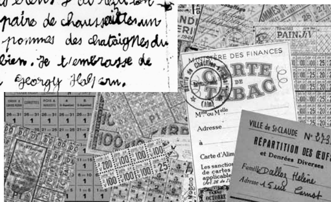
Tickets de rationnement.